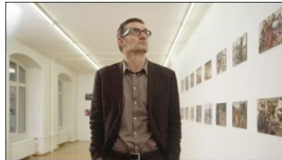
Thomas Hirschhorn (pavillon suisse)