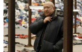
Christian Boltanski (pavillon français)